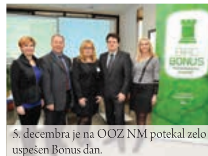
5. decembra je na OOOZ NM potekal zelo uspešen Bonus dan.

Za upokojece se šteje, da so zavarovani drugje in jim ni potrebno obračunati in plačati 15,5 % PIZ. Izplačevalec je dolžan ob obračunu zgoraj navedenih izplačil pridobiti izjavo prejemnika, na kateri je navedeno, če je zavarovan drugje. V primeru dvoma je izplačevalec dolžan izjavo tudi preveriti.