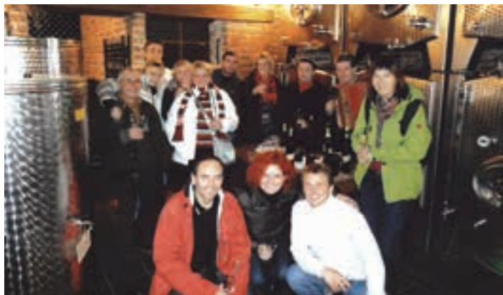
Člani sekcije v vinski kleti Vuglec-breg.

Po prijetnem druženju se je vsa 18 članska četica varno vrnila v našo Slovenijo.