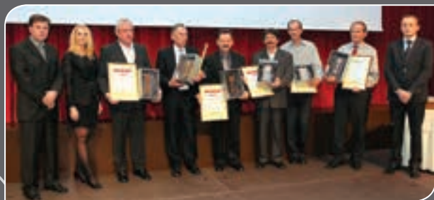
▲ Prejemniki ključev za 35, 40 in 45 let dela v obrti