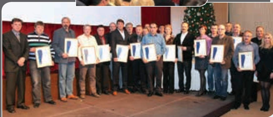
▼ Prejemniki bronaste plakete za 20 let dela v obrti