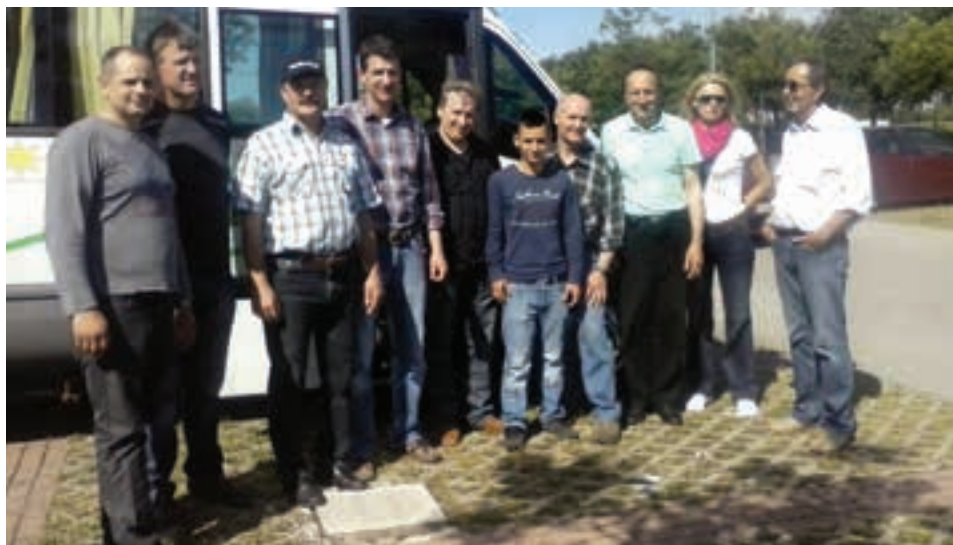
Avtoserviserji ne sejmu v Bologni

V prvi polovici leta smo bili zelo aktivni, saj smo izpolnili vse načrtane plane dela, katere smo si jih zastavili v začetku leta. Tako smo se udeležili nadaljevalnega programa izobraževanja v Novi Gorici pri podjetju avtomehnika Arčon, kjer se je izvedel praktični del na temo Vbrizgalni sistemi v vozilih. Podjetje je pooblaščen Bosch diesel servis, kjer se ukvarjajo z diagnostiko odkrivanje napake in kakovostnim popravilom, ter obnovo vseh vrst dizelskih vbrizgalnih sistemov. Delavnico imajo opremljeno z najsodobnejšim orodjem in diagnostičnimi napravami.