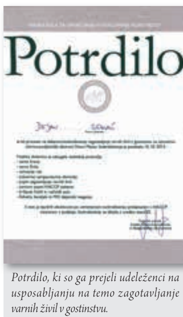
Potrdilo, ki so ga prejeli udeleženci na usposabljanju na temo zagotavljanje varnih živil v gostinstvu.

tobru in novembru 2013 smo članom sekcije za gostinstvo in turizem OOOZ Novo mesto izvedli tri izobraževalne delavnice na temo zagotavljanje varnih živil v gostinstvu.