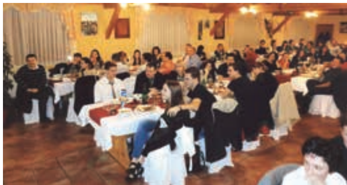
OOZ Novo mesto je bila organizator letošnjega tradicionalnega regijskega gostinskega plesa