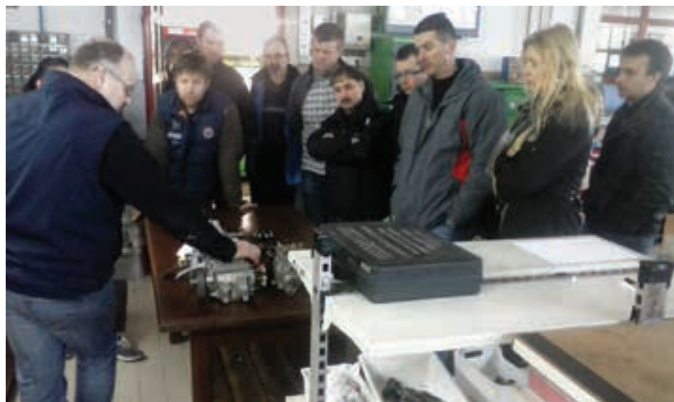
Na izobraževanju v Avtomehniki Arčon

na tema delovanje naše sekcije avtoserviserjev glede na trenutne razmere, katere so se odvijale na celotni zbornici. Na tem srečanju je bila izvedena kratka delavnica, kjer so bili prisotni člani vprašani o občutkih, izkušnjah in predlogih glede delovanja sekcije avtoserviserjev. Pokrovitelj srečanja pa je bilo podjetje Petrol d.d., kateri je predstavil ponudbo za avtoličarske delavnice z naslovom PREDELAVA LIČARSKE KOMORE iz kurilnega olja na PLIN. Na koncu smo imeli majhno pogostitev s strani Petrola d.d., kjer so potekali živahni razgovori in dogovori.