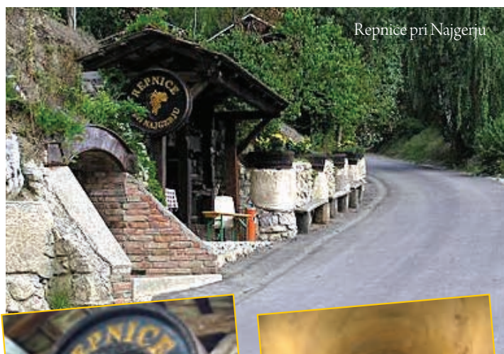
Repnice pri Najgerju