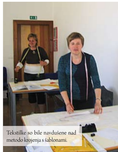
Tekstilke so bile navdušene nad metodo krojenja s šablonami.

Glede na to, da si druga v drugi ne vidimo konkurence, ampak smo stanovske prijateljice, ki smo si vedno pripravljene pomagati, nimam bojazni, da tudi v letu 2012 ne bi izpolnile začrtanega plana dela v celoti.