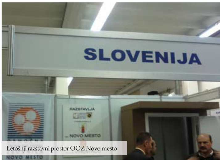
Letošnji razstavni prostor OOOZ Novo mesto