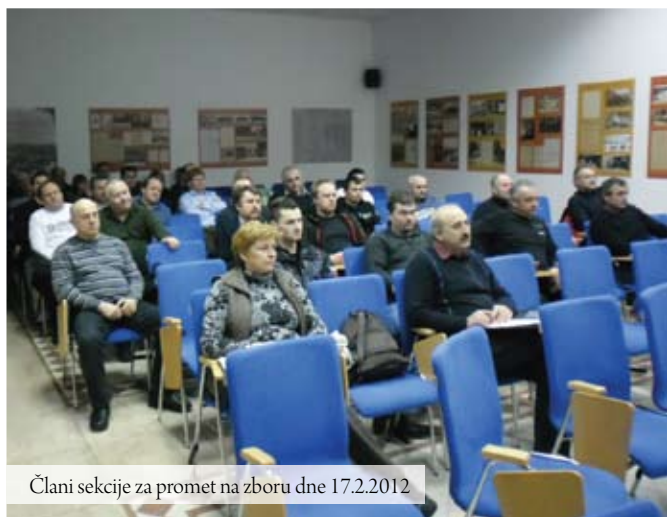
Člani sekcije za promet na zboru dne 17.2.2012

Izvršilni odbor sekcije za promet je v februarju 2011 organiziral zbor sekcije. Izkoristili smo priliko srečanja članov ter organizirali tudi obvezno 7 urno izobraževanje za kodo, ki smo ga nato ponovili še kar petkrat.