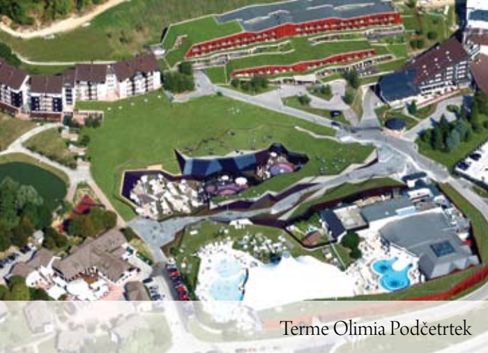
Terme Olimia Podčetrtek