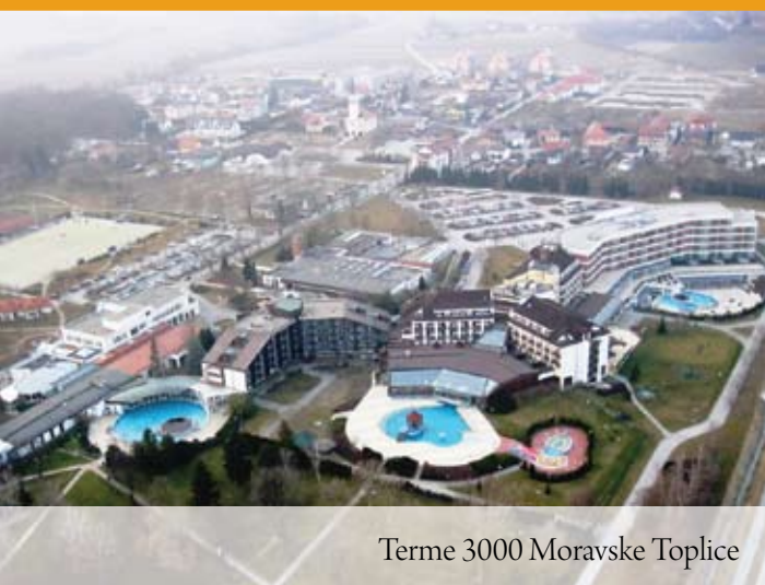
Terme 3000 Moravske Toplice