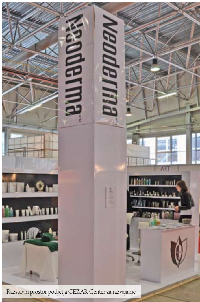
Razstavni prostor podjetja CEZAR Center za razvajanje

Na 3. sejmu Frizerstvo in Kozmetika, ki se je odvijal 4. in 5. februarja 2012 v Celju, se je predstavila tudi vrhunska profesionalna kozmetika Neoderma. CEZAR Center Za razvajanje je mlado podjetje, ki z inovativnostjo in drznostjo nadaljuje trženje svetovno priznane ciprske kozmetike Neoderma na slovenskem trgu. Na njihovem razstavnem prostoru so se obiskovalci seznanjali z raznolikostjo Neoderma izdelkov in preizkušali njihovo učinkovitost kar na mestu samem, saj so tam izvajali prikaze profesionalnih postopkov za nego obraza. Navdušenost obiskovalcev nad Neoderma Bio-peeling nego obraza je potrdila najnovejše izsledke anket, da se stranke nagibajo k naravnim in neinvazivnim metodam ohranjanja mladostnosti in reševanja kožnih problemov, kakor tudi uporabi učinkovitih in neagresivnih izdelkov za domačo uporabo.