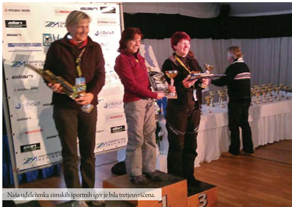
Naša udeleženka zimskih športnih iger je bila tretjevrščena.

Za letošnji spomladanski izlet na Irsko pa je tako že vse urejeno in upam, da se bodo udeleženci imeli lepo.