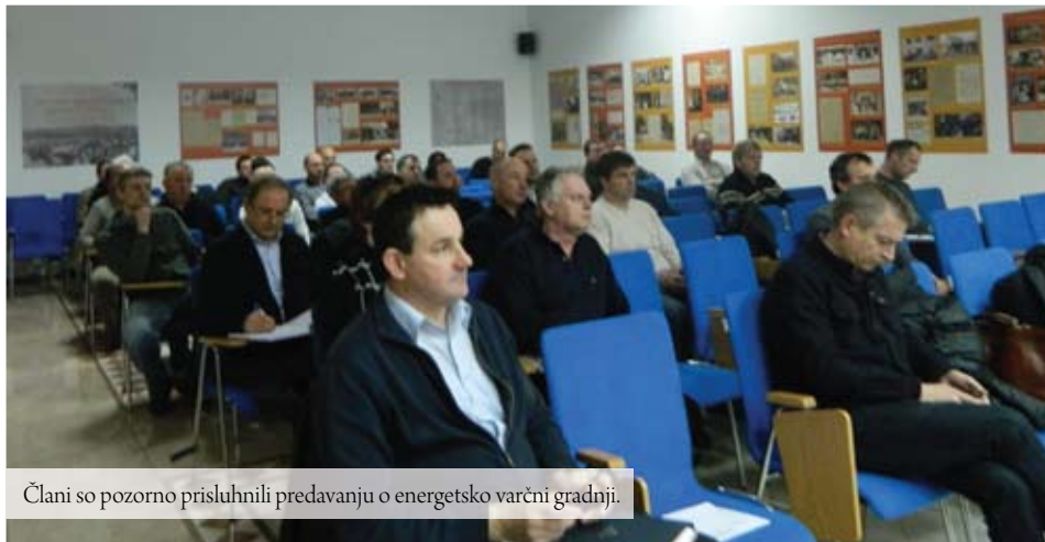
Člani so pozorno prisluhnilo predavanju o energetsko varčni gradnji.

Tudi obstoječi objekti morajo pridobiti tako imenovano energetsko izkaznico, ki s svojimi parametri prikazuje v kakšnem stanju je objekt. Ta izkaznica je tudi osnova za načrtovanje energetske sanacije.