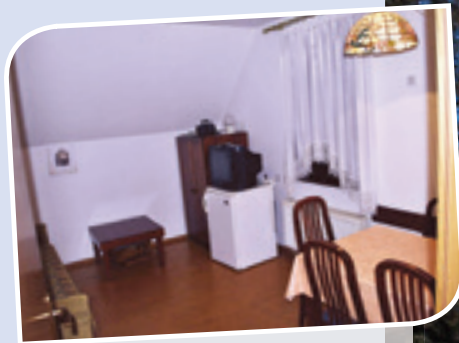
Dnevna soba z jedilnico in kuhinjo

V razdalji 12 km se nahaja mesto Velenje in v razdalji približno 40 km naše znano smučišče Rogla.