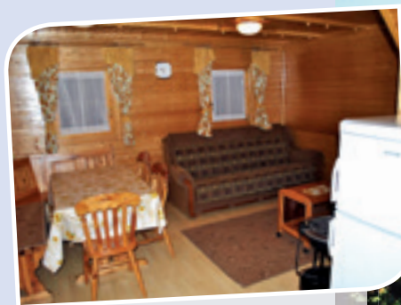
Dnevna soba v hišici H-8 Terme Olimia

V hišici lahko biva istočasno največ sedem oseb. Je prijetnega videza in občutka, saj les daje človeku posebno domačnost.