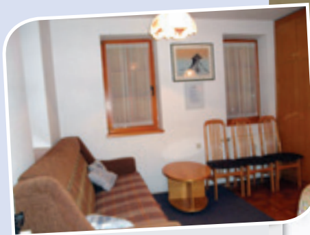
Dnevna soba v hišici C-06 v Moravskih Toplicah

Postavljena je v sklopu Apartmajskega naselja. Daje občutek prijaznosti in domačnosti. V njej lahko istočasno biva 6 oseb.